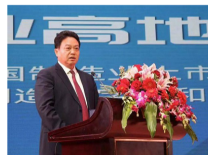
中共海安市委副书记、市长于立忠在论坛致辞

海安市委书记顾国标在论坛上强调，海安坚定不移实施“产业强市”战略，深耕实体经济，致力创新驱动，实体经济，特别是制造业经济发展一直走在省市前列。全市规模工业企业、亿元企业、高新技术企业数长期位居江苏第一方阵，拥有磁性材