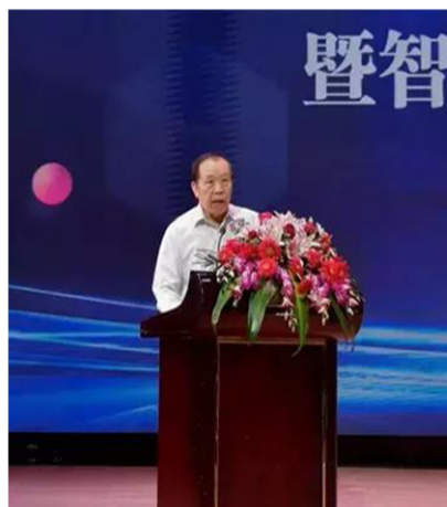
中国工业经济联合会执行副会长路耀华致辞