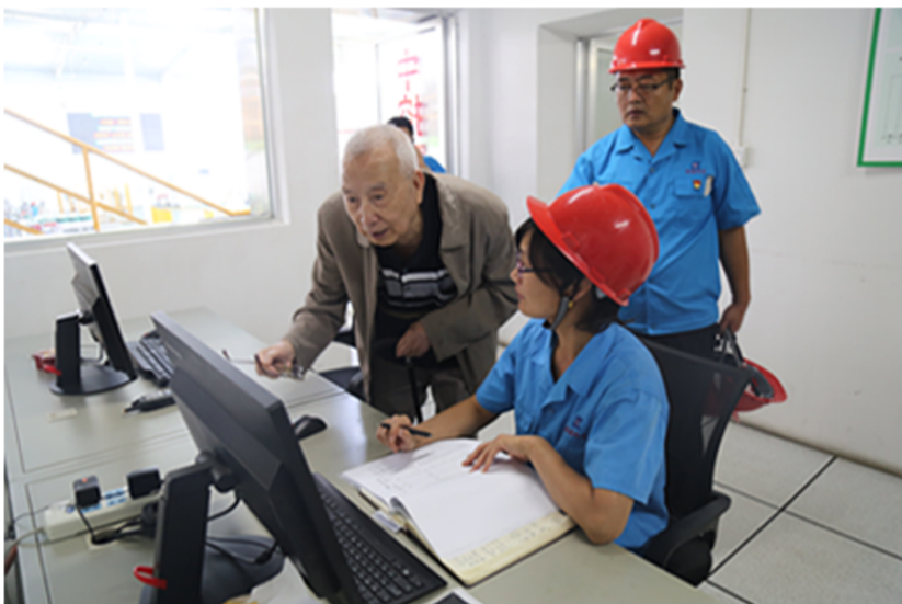
国家机械工业部原副部长沈烈初（左一）在南通科星化工有限公司考察指导工作