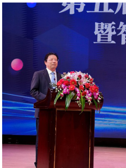
中共海安市委书记顾国标在论坛发言

海安市委书记顾国标在论坛上强调，海安坚定不移实施“产业强市”战略，深耕实体经济，致力创新驱动，实体经济，特别是制造业经济发展一直走在省市前列。全市规模工业企业、亿元企业、高新技术企业数长期位居江苏第一方阵，拥有磁性材