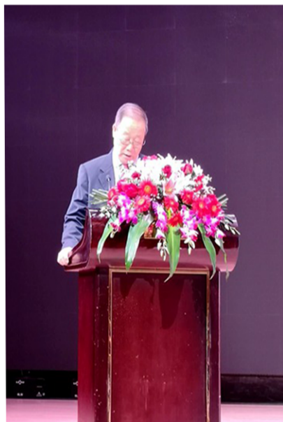
中国证监会首任秘书长、国务院监事会主席马忠智发布《2019年度中国制造业上市公司价值创造研究报告》

料、时尚锦纶、电梯零部件、建材装备等10多个国家级特色产业基地。2015年工业应税销售突破千亿元大关，今年有望突破2000亿元。在全国工业百强县（市）排名中列第26位，是全国首批创新型县（市）建设单位、全省科技创新体制综合改革试点地区。当前，海安正以项目建设、科技创新为主抓手，着力构建以七大专业园区为主阵地的实体经济、制造业经济发展的新格局，全力推动工业经济攀高走强。